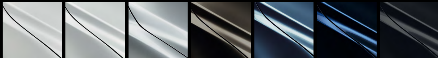
ARCTIC WHITE (A4D) SNOWFLAKE WHITE (25D) SONIC SILVER (45P) TITANIUM FLASH (42S) ETERNAL BLUE (45B) DEEP CRYSTAL BLUE (42M) JET BLACK (41W)